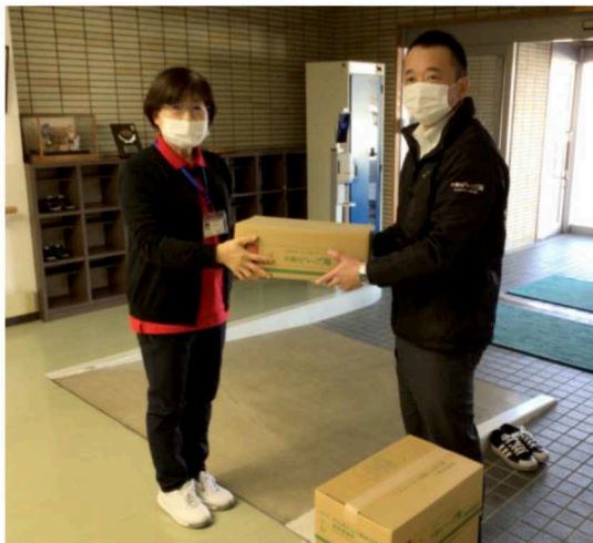
米久おいしい鶏様 鶏肉