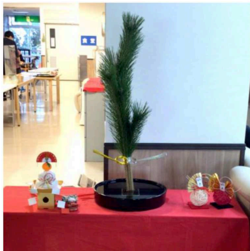
大谷様 お正月の活け花