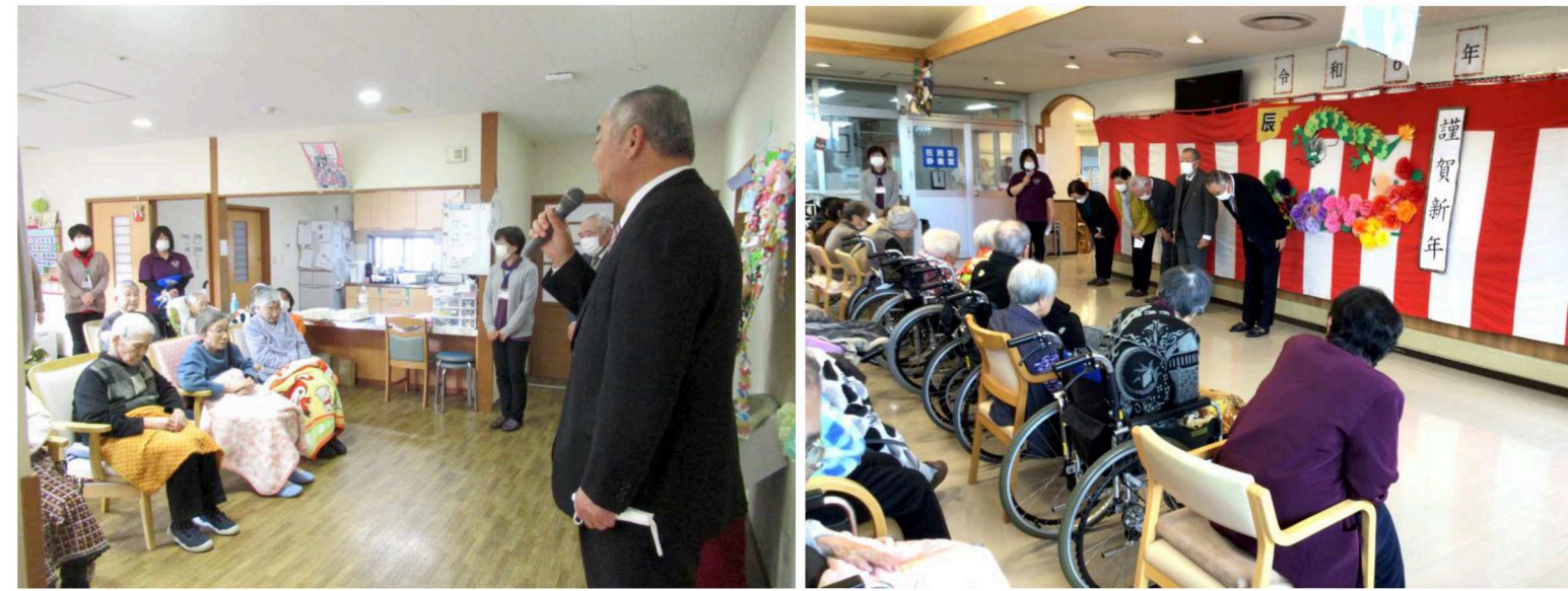
▲1月4日、理事長と理事、監事、家族会長、後援会長で各施設にて新年の挨拶をさせていただきました