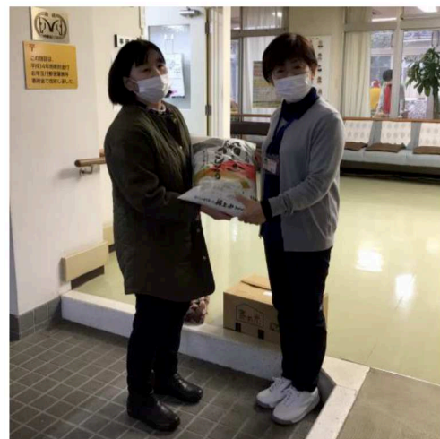
JA 赤碓支部女性会様 お米、タオル、雑巾