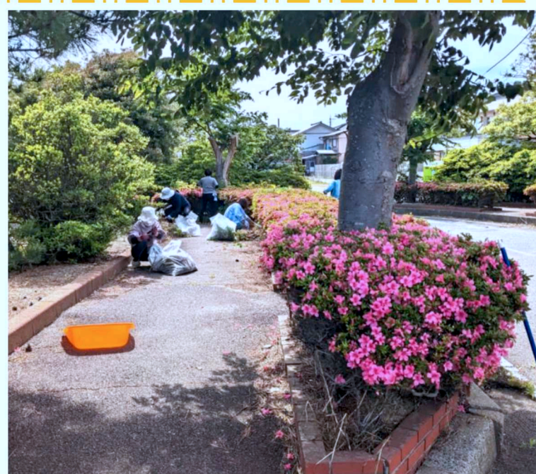
▲消防署員の指導の下、救命講習を実施しました。 ▲汗ばみながらも手早く綺麗にすることができました。