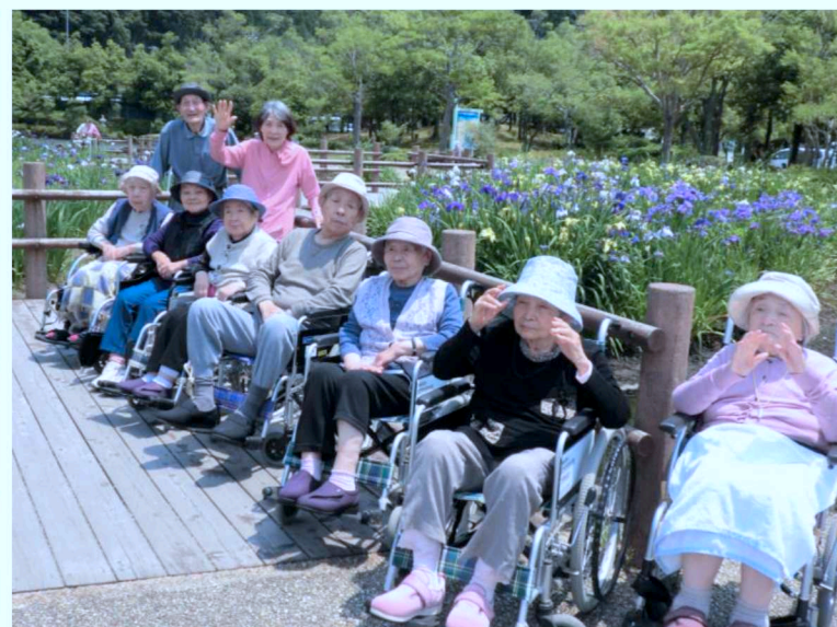
▲グループホームのあじさい公園やあやめ池、花回廊への外出の様子。