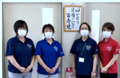
ホームヘルパーセンター 訪問介護士一同

皆さまの個々の能力を踏まえながら、いつまでも住み慣れた自宅で暮らすためのお手伝いをしています。介護保険制度内でのサービスなので、出来ないこともありますが、ご希望に寄り添った支援を心がけています。ご利用をお待ちしております。