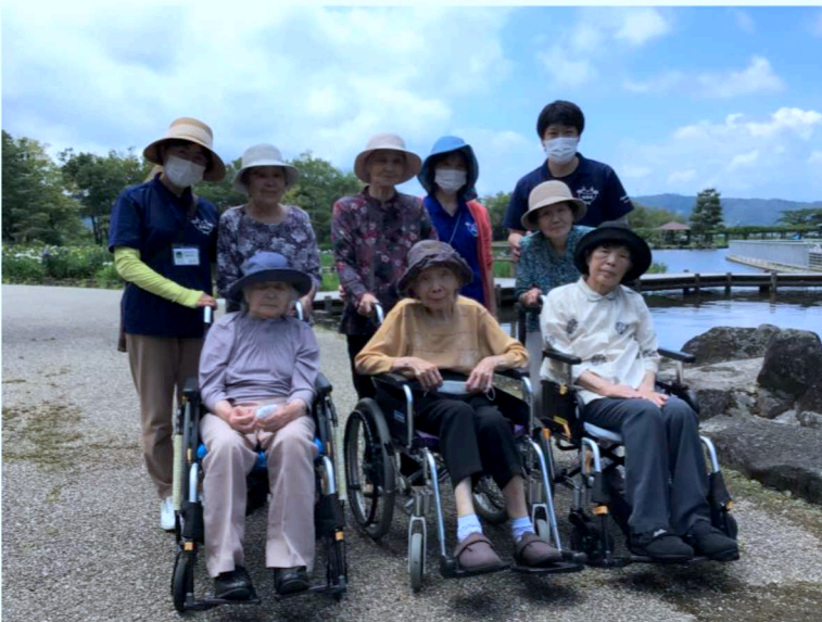
▲特養で蓮の花を見に淀江に外出した様子。