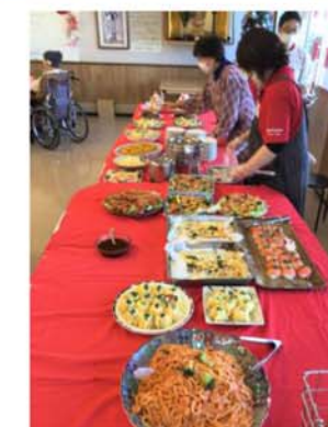
▲特養ではバイキングを行いました♪