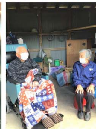
▲コロナ禍でも 顔を見れば 伝わる幸せ