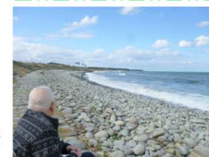
▲鳴り石の浜に願いを込めて

毎年、全国老協が主催する介護フォトコンテストに参加しています。どれも日常の素敵な一場面です。