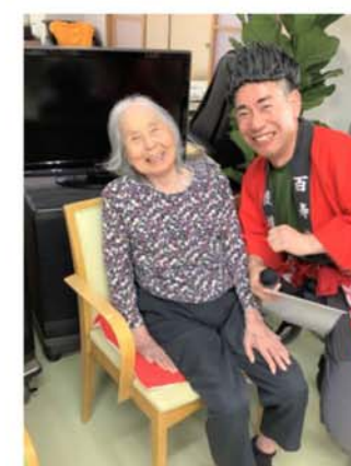
▲あんだおもしろいな〜