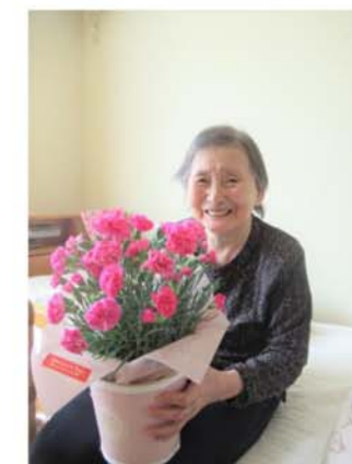
▲母の日のプレゼント