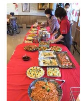
▲特養ではバイキングを行いました♪