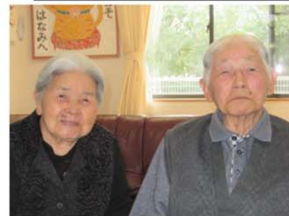
▲私の一番大事な人