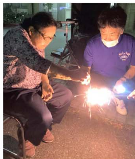
▲花火で夏を感じました