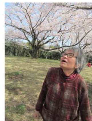
▲満開な桜の木の下で