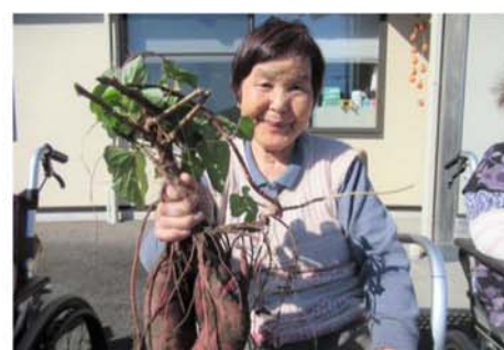
▲大きな芋が収穫できました