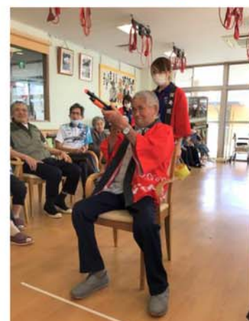
▲秋祭り！よ〜く狙って！