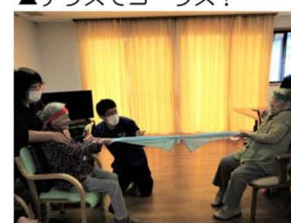
▲真剣勝負の運動会