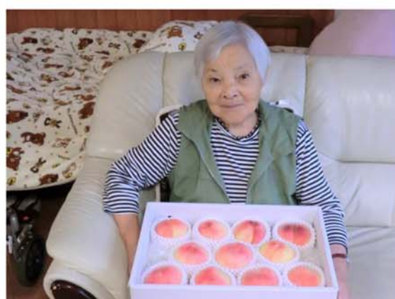
▲綺麗な桃に思わずニンマリ♪