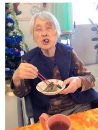
▲サンマパーティや忘年会も行っております