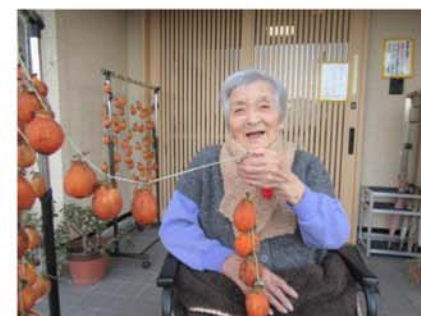
▲なんちゅう美味げな柿だらあか