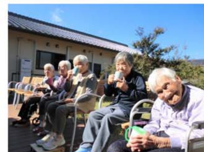
▲今日はええ天気だなあ

毎年、全国老協が主催する介護フォトコンテストに参加しています。どれも日常の素敵な一場面です。