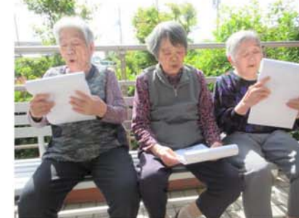
▲テラスでコーラス！