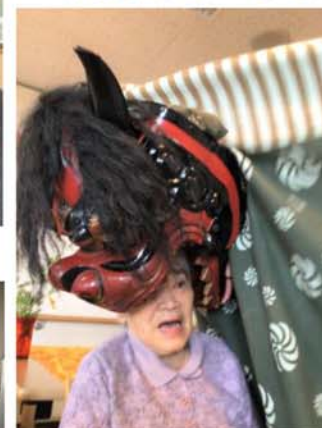
▲長寿願う 驚き慶び 獅子の舞い