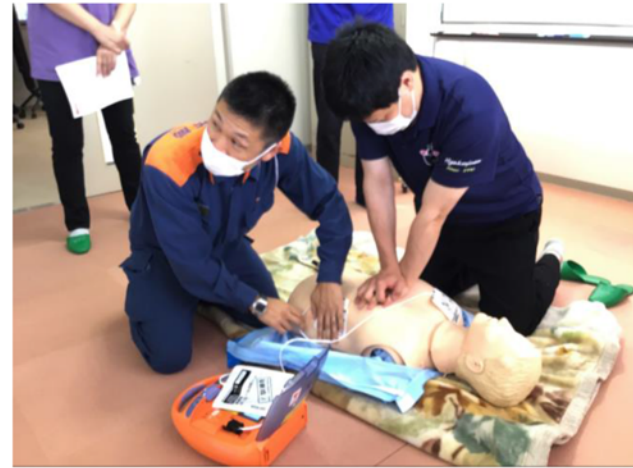
▲消防署指導のAEDによる心肺蘇生法講習