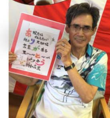
▲事業所にも敬老会の装いを凝らし、お祝いの食事を楽しんで頂きました。