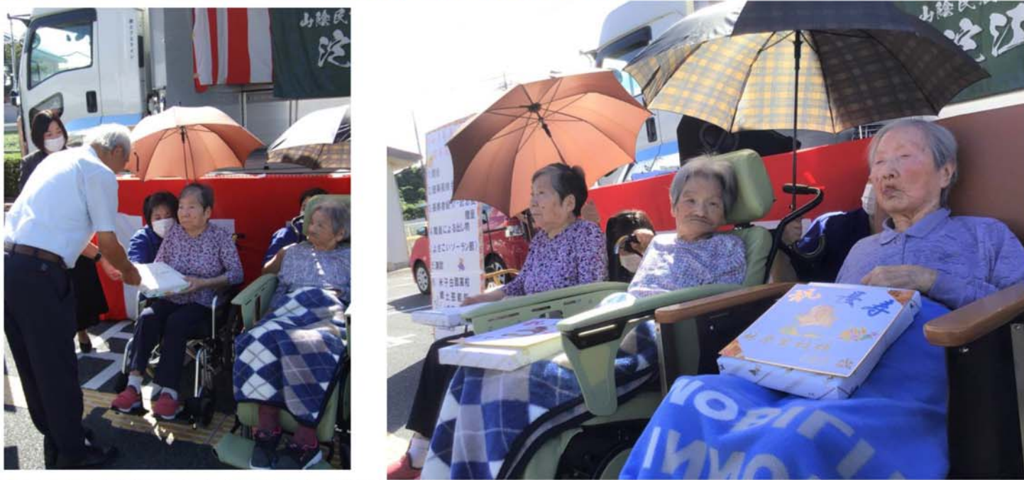
▲節目の年齢を迎えられた利用者の皆様に長寿の祝いの記念品を贈呈しました。

9月19日特養・グループホーム合同の敬老会を開催しました。久々の大規模な行事でしたが、晴天のもと地域の方々の御協力もあり、ご利用者様と楽しい時間を過ごすことが出来ました。