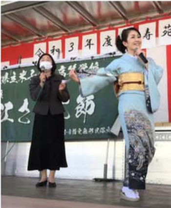
▲会場設営と舞台演出にご協力頂きました F'sLine 様、米子白鳳高校様、牧野和美様有難うございました。