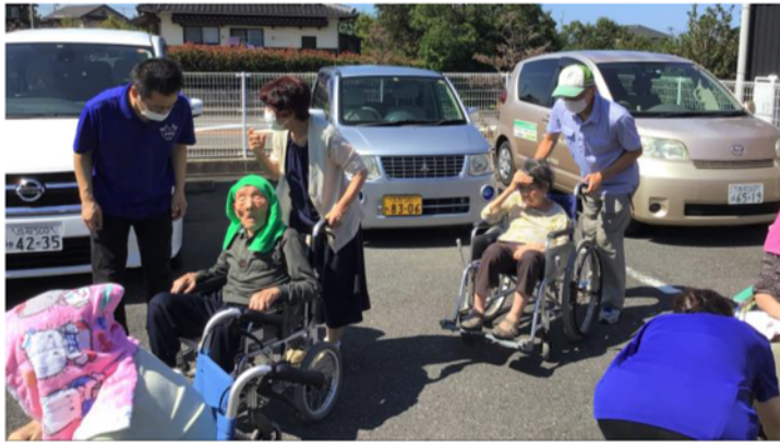
▲地域住民参加での避難誘導