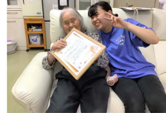
▲職員から感謝状を贈呈いたしました。