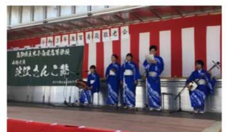
▲米子白鳳高校の生徒さんによる「淀江さんこ節」です