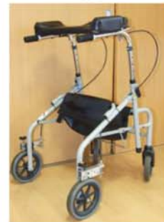
▲(有)ウェルアップ様より寄贈していただきました