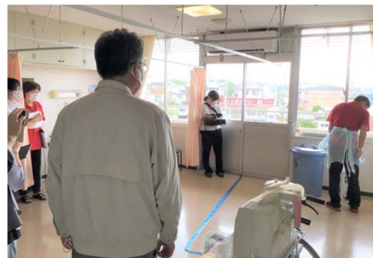
防護具の着脱方法を確認

9月18日、鳥取県福祉保健部と県看護協会立会いのもと、新型コロナウイルス感染症にかかるソーニングの現地指導及び実際に感染者が発生したことを想定した模擬訓練を実施しました。 この訓練により利用者の生活支援を主体とした福祉施設において感染防止に不足している点や重要な点等多くの事を気付かされました。ソーニングの手法・注意事項、各ゾーン内での行動、手指消毒のタイミング、防護具の着脱方法等々、平常時に行っている感染対策では足りない点について多く指摘を受け、感染対策マニュアルの見直し、職員の再研修・訓練を行い利用者の安全を図っていきます。(施設長より)