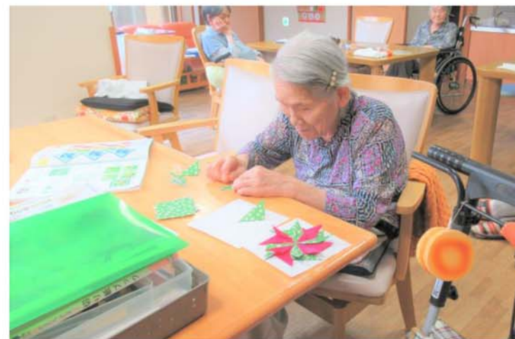
グループホームでは壁飾り製作に熱中しておられます。完成が待ち遠しいです。