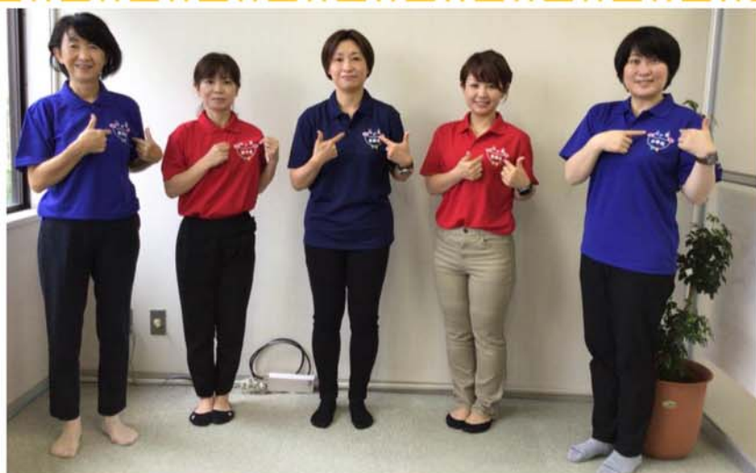
青、赤、紺、赤、青の並びです (あかさき介護支援センターにて)

※ポロシャツ作成にあたって「琴浦町医療・介護施設等事業継続支援金」を活用させて頂きました。