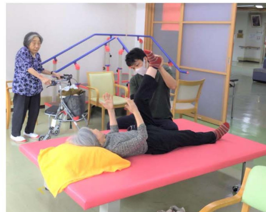
痛みが和らぐよう施術しています