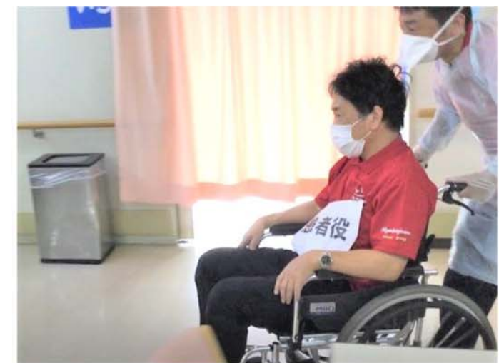
患者役を相談員が熱演