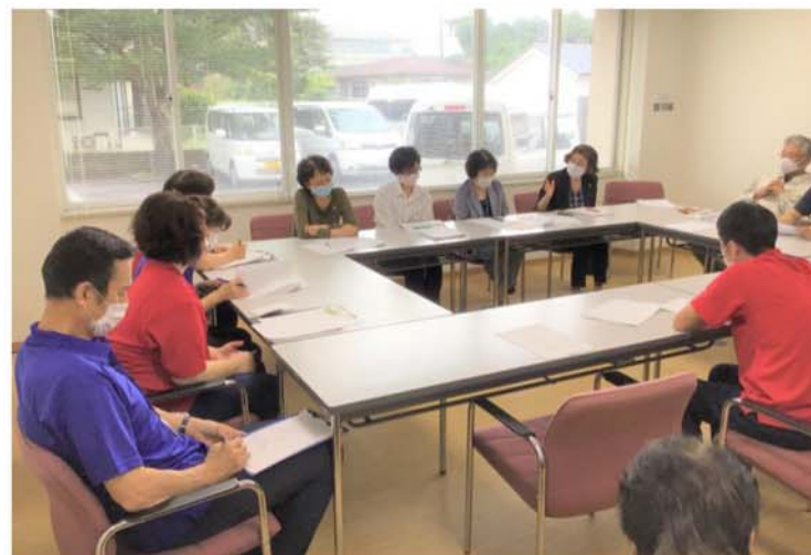
反省会で助言を頂きました