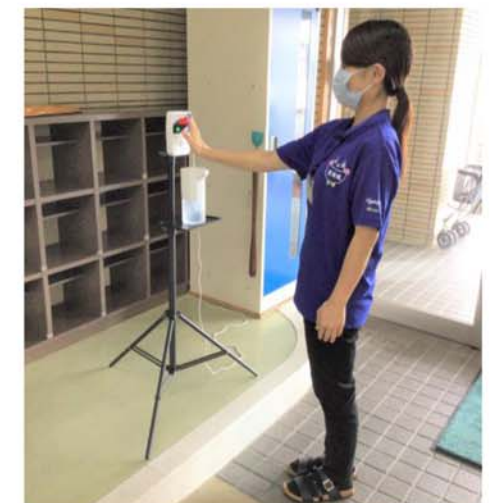
設置型の自動検温器導入しました