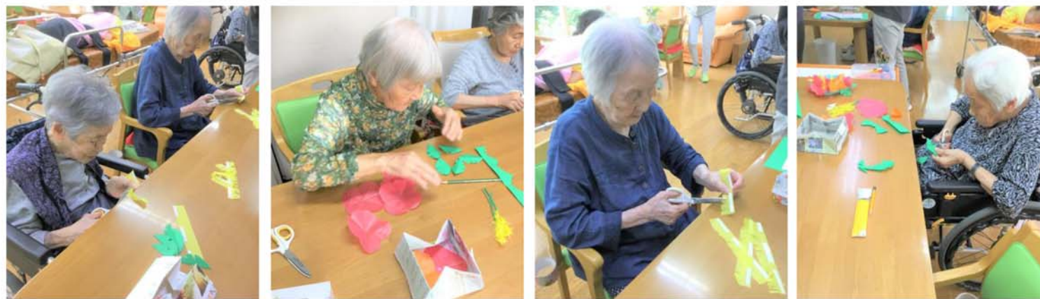
百寿苑デイサービスでは皆様器用に細かい作業をされています。何が出来るのでしょうか・・・