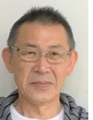
厨房 調理員 表 則人