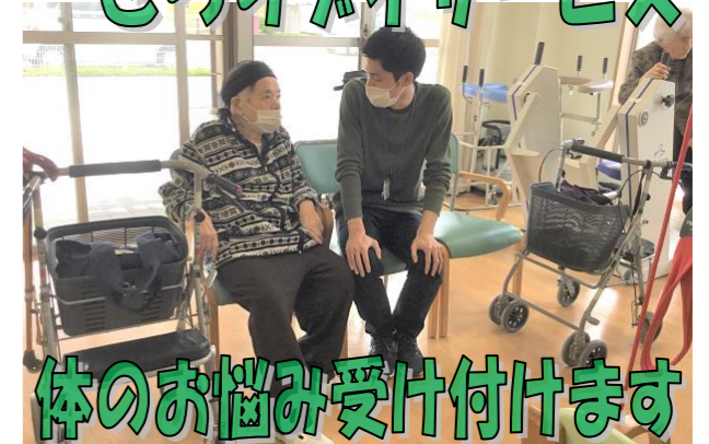
体のお悩み受け付けます