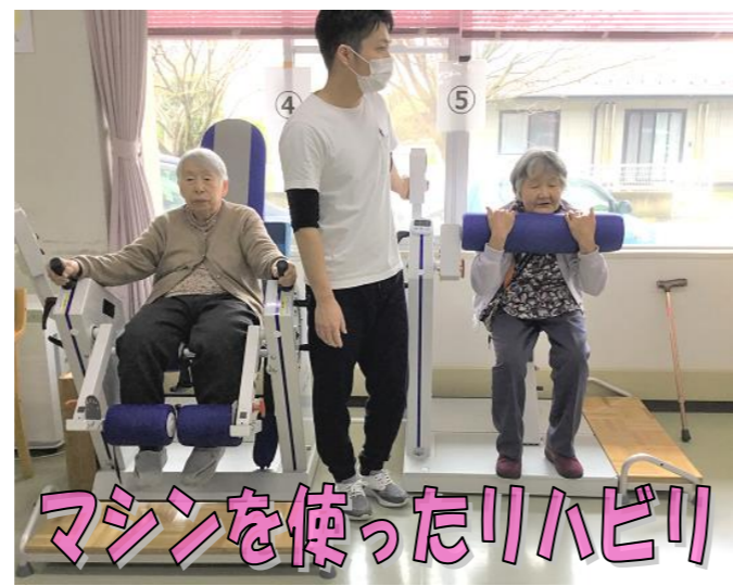
マシンを使ったリハビリ

基本はリハビリ機器を使って機能訓練を行いますが、その人に合わせて、体の使い方の助言やメニューの調整を行っています。 コロナウイルスによる休止にも備えて、ご自宅で取り組めるメニューも用意致します。お気軽にご相談ください。