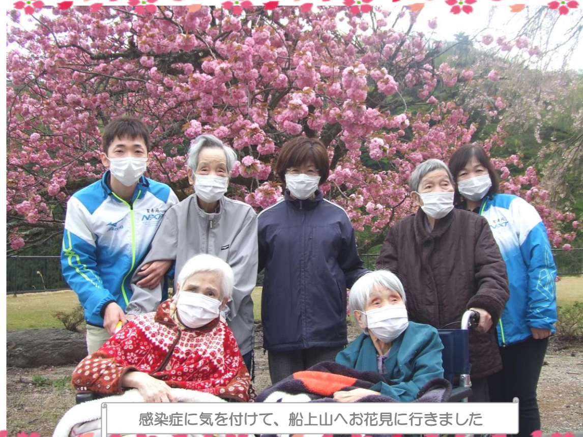
感染症に気を付けて、船上山へお花見に行きました

桜の花も散り、山藤の花が見られる一年の中で一番良い季節となりました。世界では新型コロナウイルス感染症がパンデミックな状況となり、日々更新される感染者数の増加、連日繰返される報道と、感染への不安と緊張感のなかで、当施設もこの難関を乗り越えようと、感染防止にむけて全職員が一丸となって取り組んでいます。入所者ご家族の皆様には、面会の自粛をお願いしており、面会のできない期間が大変長くなっています。写真と手紙で入所者様の様子をお伝えする、ウェブを活用したテレビ電話の導入等、ご家族の心配が少しでも軽減されるよう努力してまいります。当施設は令和二年度スローガンを「ブランドカ」としました。地域の方に、また就職を目指す方に選ばれる施設となるよう、地域で一番店を目指す努力を怠ることなく、ご利用者様の環境面の改善・健康への配慮・介護力の向上等サービスの向上に取り組んでまいりますので、今後ともご支援のほどよろしくお願いいたします。