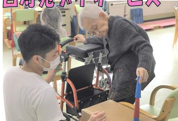
退院後の日常生活動作の練習