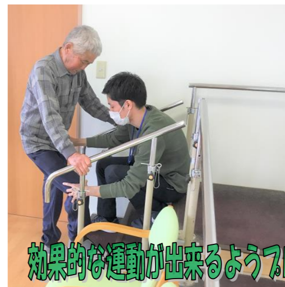
効果的な運動が出来るよう歩口の目線でしっかりサポートします