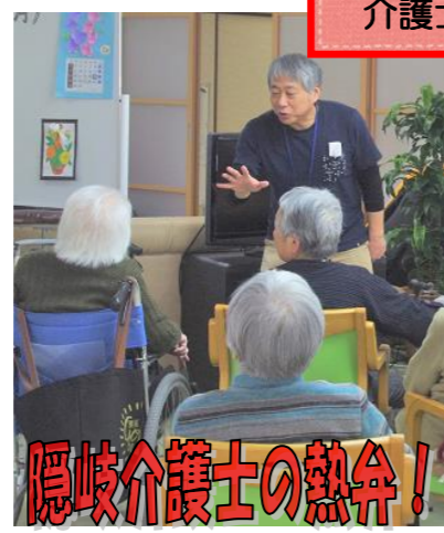
隠岐介護士の熱弁！