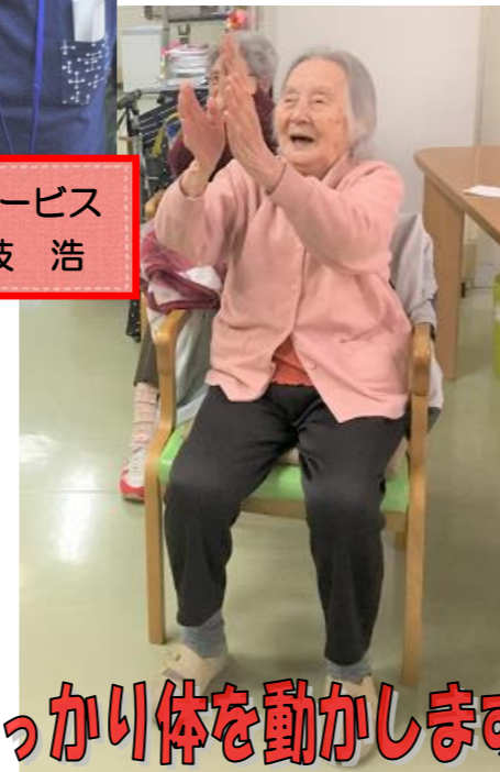
しっかり体を動かします