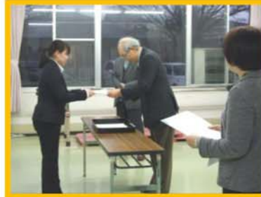
4月1日 辞令交付式を行いました。