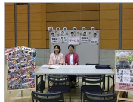
総務課と介護職員とで求人チームを結成し就職フェア等に参加しています。