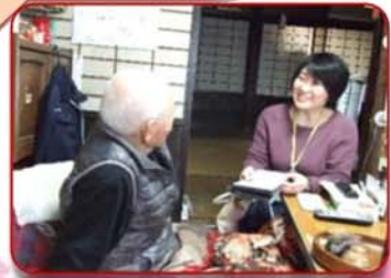
ご自宅訪問にて相談