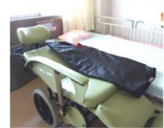
▲スライディングシート