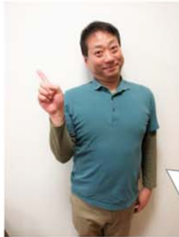
百寿苑 デイサービスセンター 隠岐介護士

定期的に地域の公民館に出かけて、健康管理についての座談会を開催、頭・指先・全身を動かす体操やレクリエーションを行っています。地域の方々が、いつまでも健康で現在の生活を継続できるようこれからも取り組みを継続して参ります。今後とも、どうぞよろしくお願いいたします。主に金屋、下伊勢、別所、西町、笠見、尾張、東三軒家の公民館にて活動を行っています。皆さん一緒に楽しみましょう！