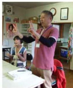
▲大きな笑い声が響きます。