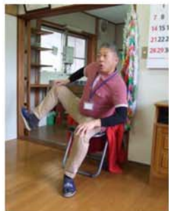
▲西町公民館にお邪魔しました。