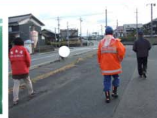
▲オレンジリングが認知症サポーターの印です。