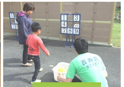
ストラックアウト