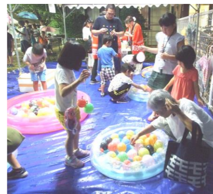
▲ヨーヨー釣り、子どもに大人気でした。