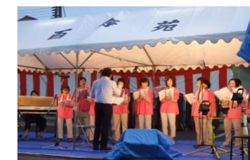
▲赤碓女声コーラスまどか様