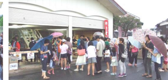
▲やきそば、長い行列ができました。