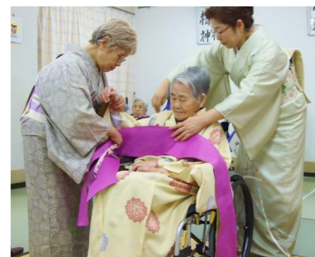
88歳と100歳以上の方は和装で、気持ちが華やきました