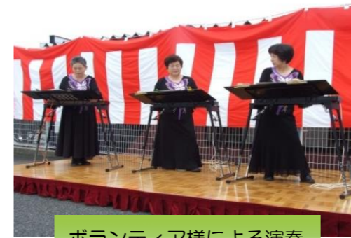
ボランティア様による演奏

10月20日(日)グループホームきらり・きらりデイサービスセンター合同でのふれあい祭りを開催しました。入居者様・家族様・地域の皆様・ボランティアの皆様、175名の方に来ていただき、うどん、おこわ等のお食事コーナーやストラックアウトや卓球、射的、ボランティアによる余興等を楽しんで頂きました。最後はビンゴ大会をして大いに盛り上がり、充実した時間となりました。皆様のご来苑、誠にありがとうございました。