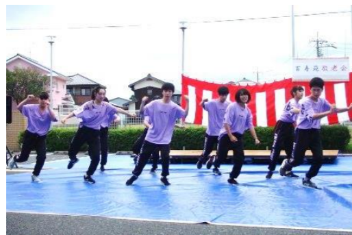
米子東高校の生徒の皆さん 若さあふれる晴れやかな ダンスパフォーマンスに魅了されました