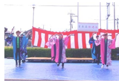
職員も「よさこい」 を踊って盛り上げま した♪