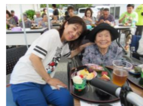
今年はスイーツ バイキング!!