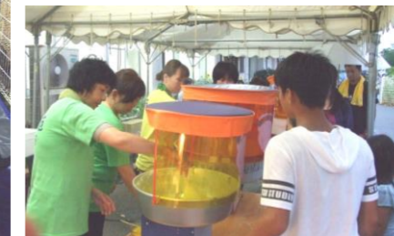
▲綿菓子機、フル稼働です。