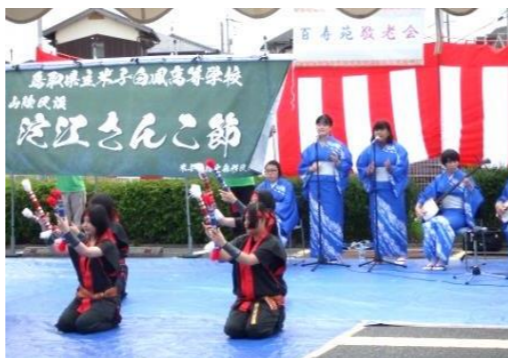
米子白鳳高校の生徒の皆さんによる 「淀江さんこ節」です