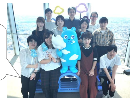
あべのハルカス300にて

9月25日・26日、職員11名で、大阪一泊二日の研修旅行に行ってきました。吉本新喜劇で笑い、美味しい物を食べ、気温32度という季節外れの暑さにも負けず、名所などを散策しました。職員間の交流にも繋がり、貴重な機会となりました。