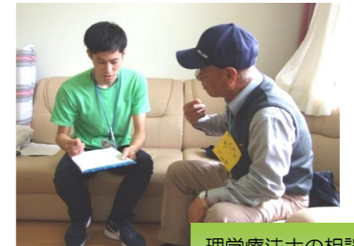
理学療法士の相談コーナー