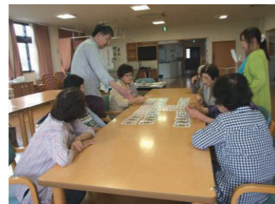
▲トランプを楽しんでいただきました。