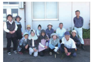
▲ 赤崎日赤奉仕団様