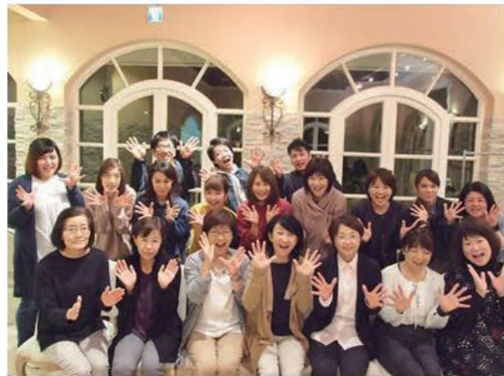
▲ 新任職員交流会にて