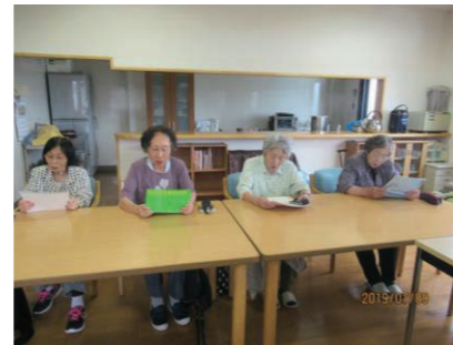
▲心を一つにして音読されています。