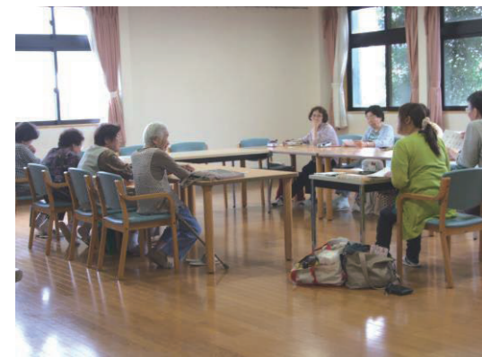
▲ゆったりした部屋の中、 笑い声に花が咲きます。